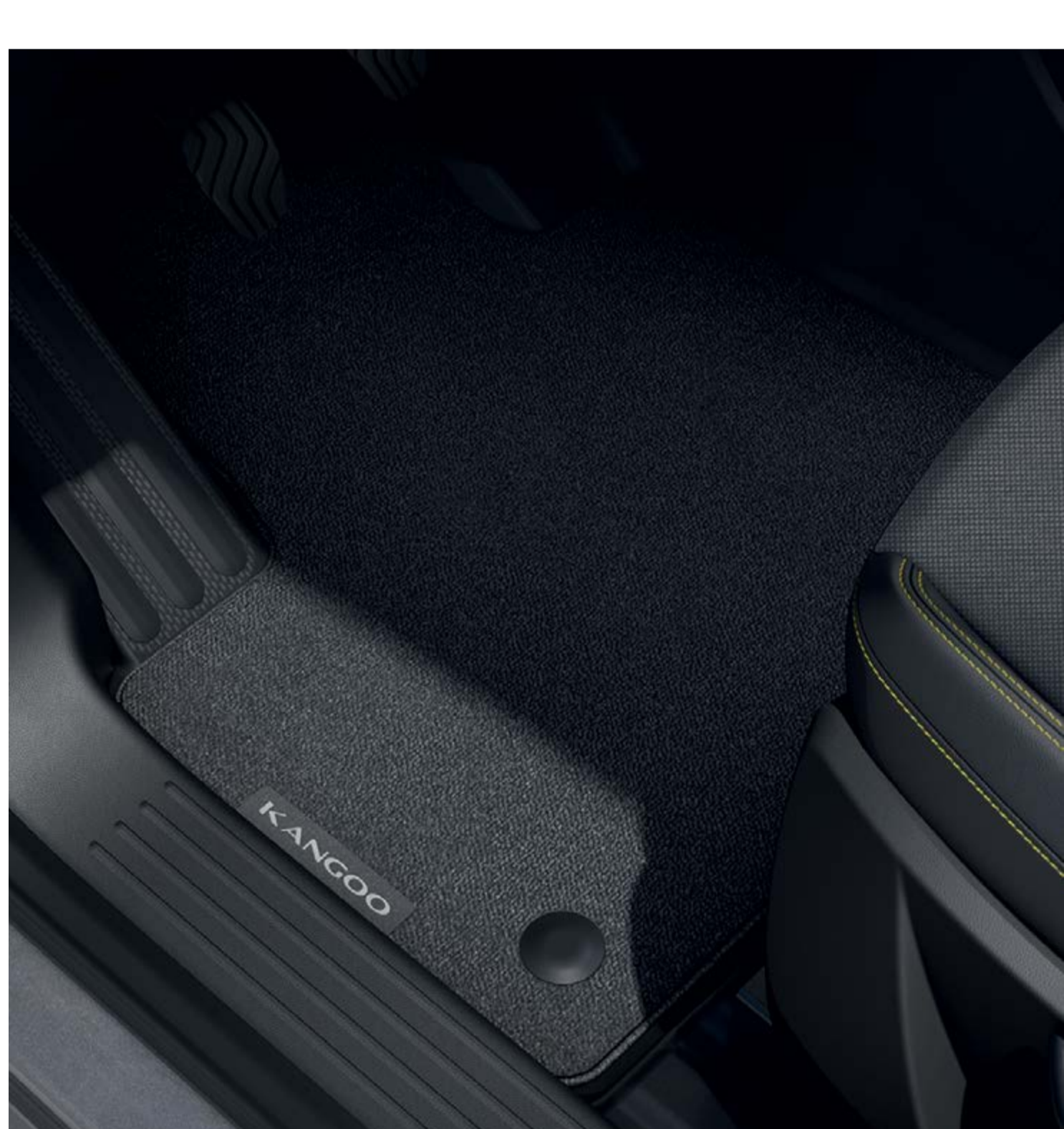
udobni tekstilni tepisi - prednja i stražnja sjedala (82 01 735 431)

Odlučite se za našu ponudu visokokvalitetnih tepiha. Pričvršćeni su kopčama i pružaju udobnost, trajnost i vrhunski izgled. Oplemenjuju cijeli putnički prostor.