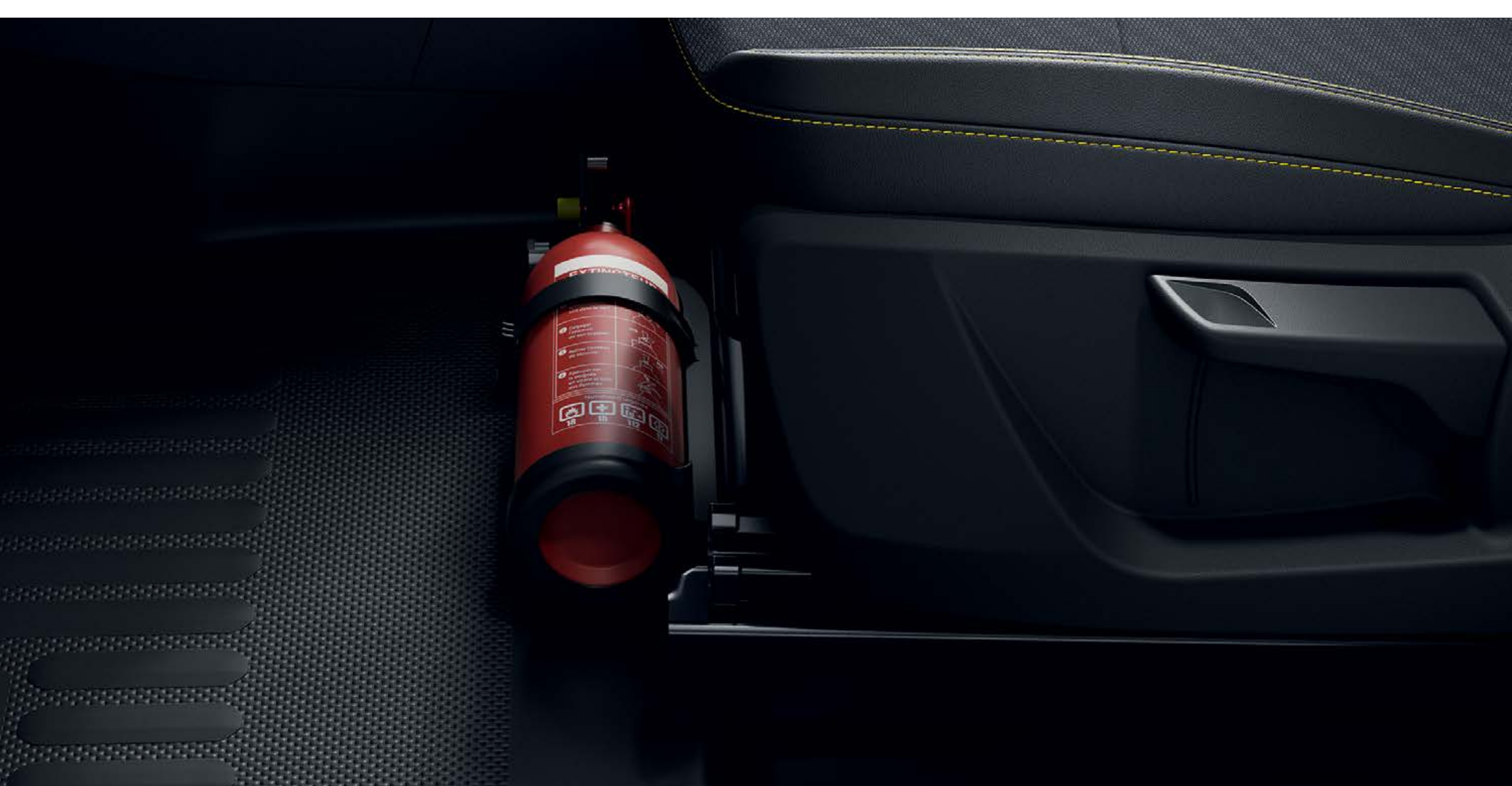
nosač za vatrogasni aparat (82 01 734 042)

Za dodatnu sigurnost opremite vozilo vatrogasnim aparatom koji vam je uvijek pri ruci zbog posebnog sustava pričvršćivanja.