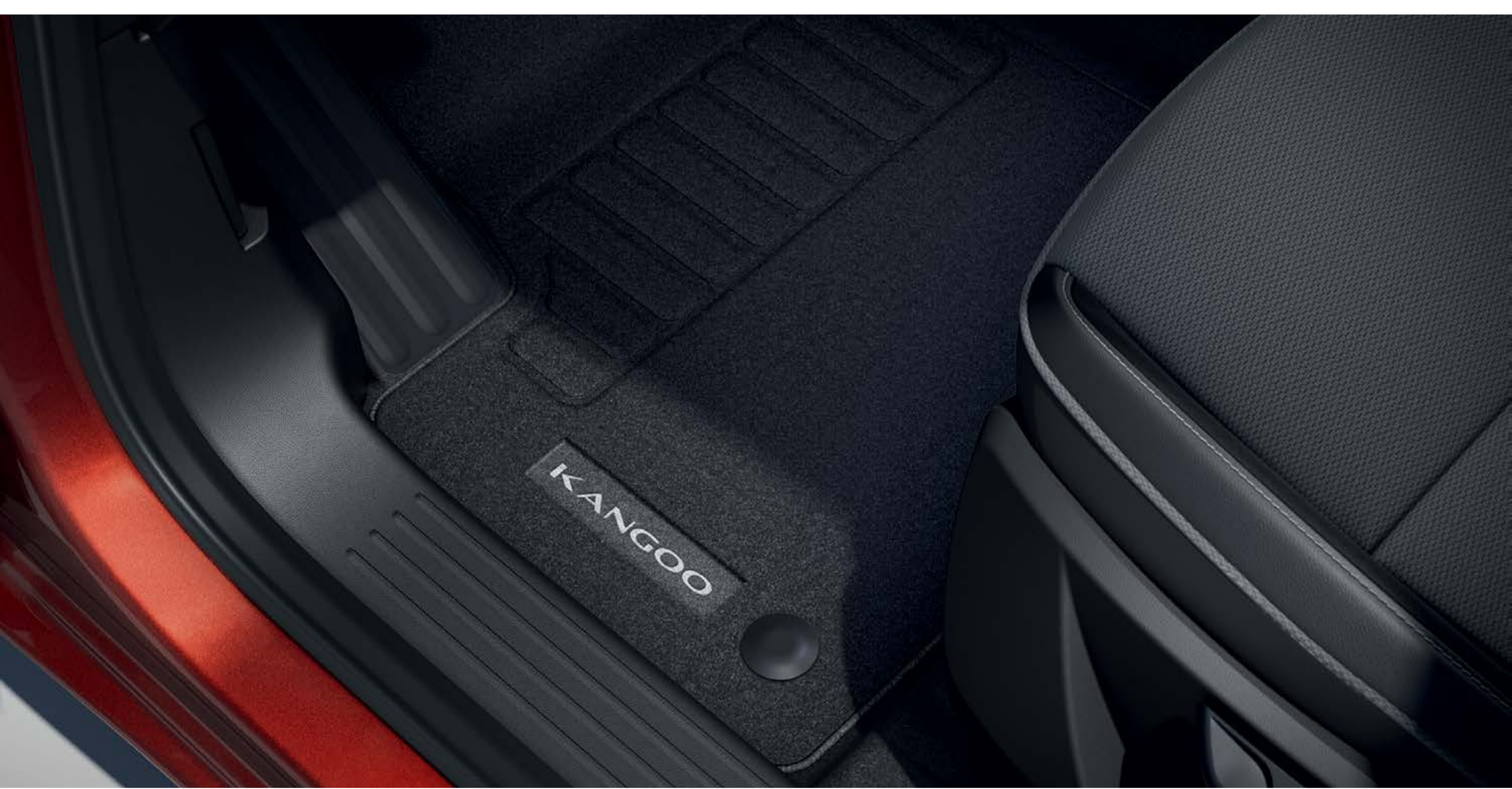
premium tekstilni tepisi - prednja i stražnja sjedala (82 01 735 433)

Odlučite se za našu ponudu visokokvalitetnih tepiha. Pričvršćeni su kopčama i pružaju udobnost, trajnost i vrhunski izgled. Oplemenjuju cijeli putnički prostor.