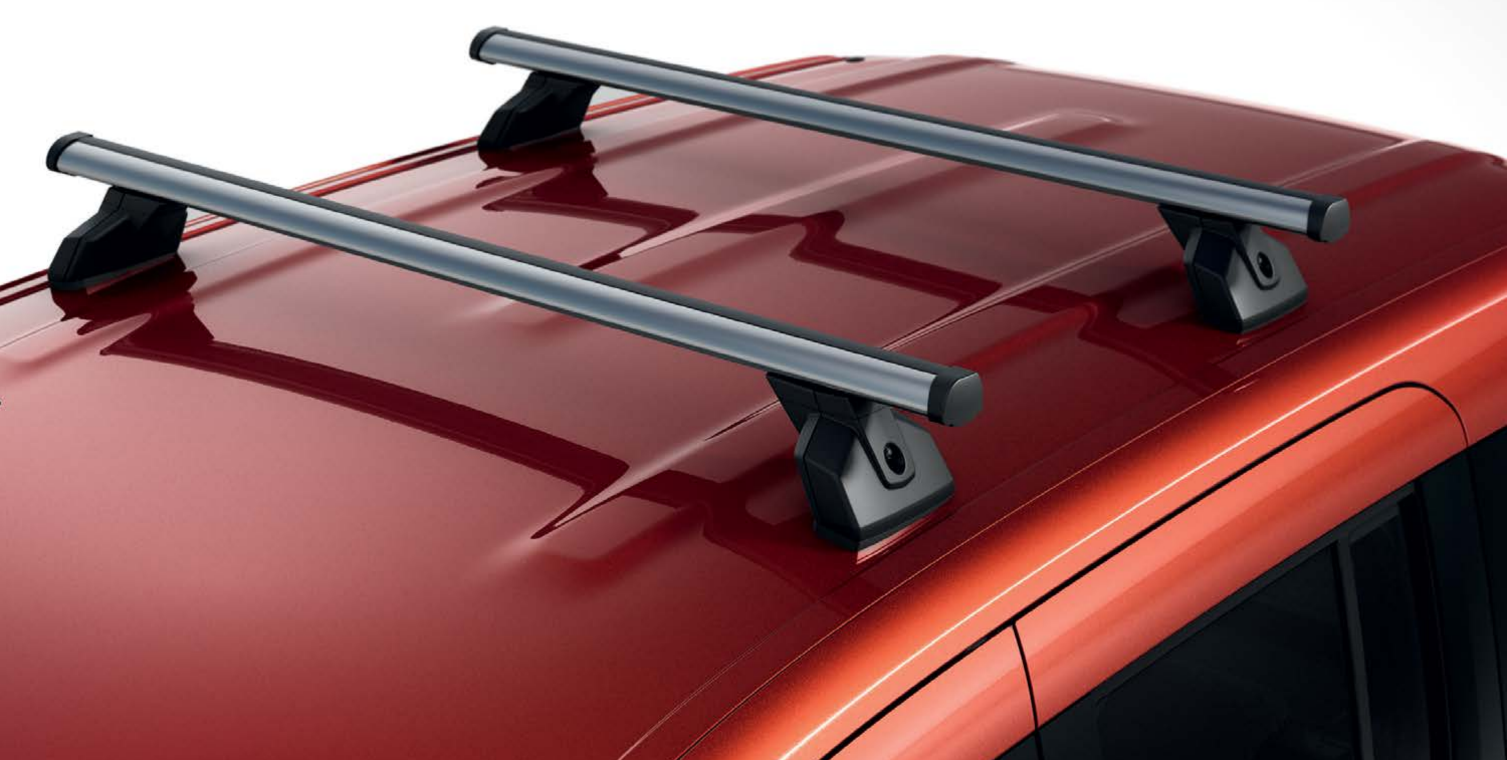
poprečni krovni nosači (82 01 729 142)

Sigurno postavite bicikle i skije na krov s krovnim nosačima Quickfix i ostalim dodacima namijenjenim prijevozu prtljage.