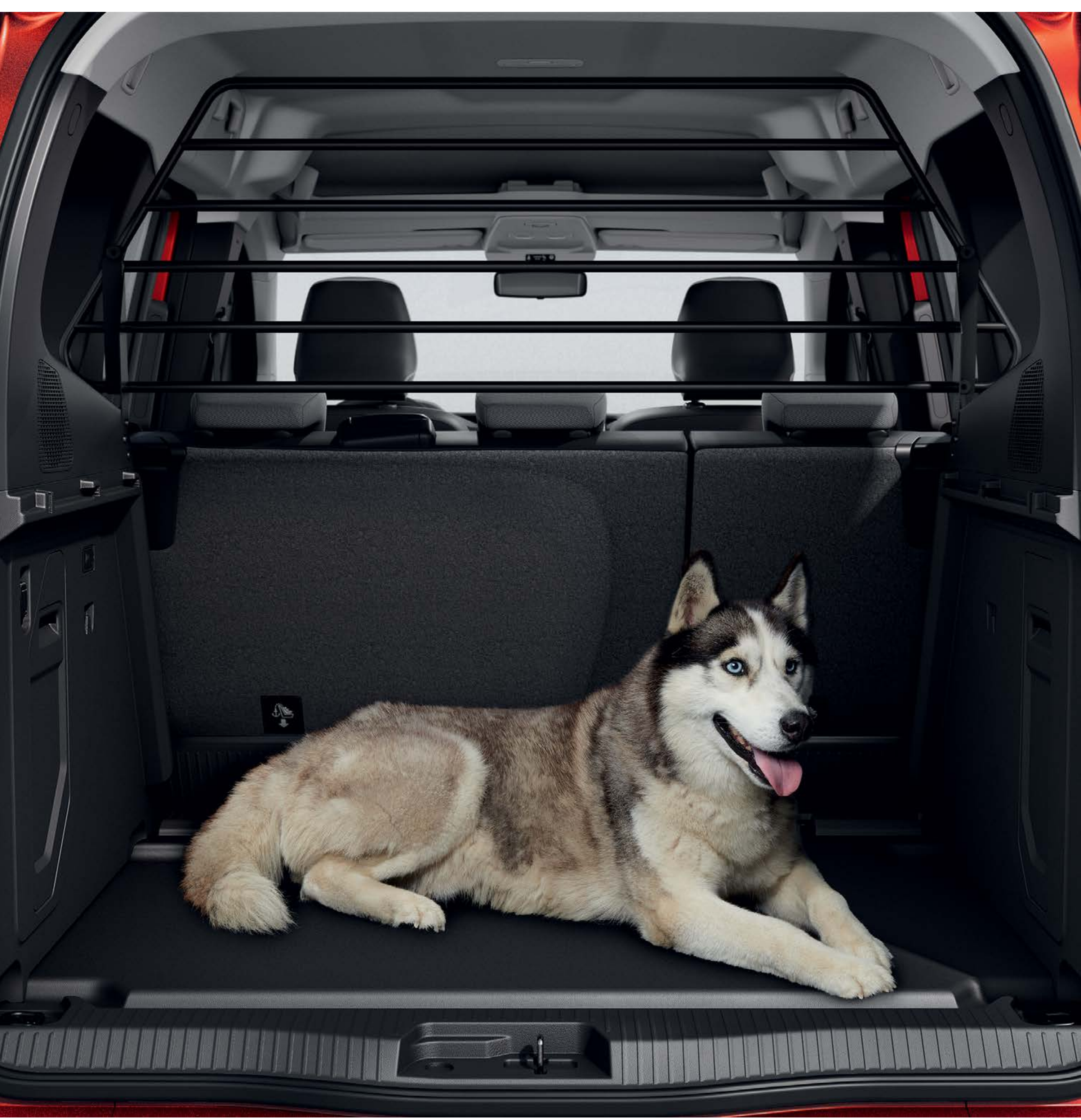
pregrada (82 01 735 148)

Ugradite u Renault Kangoo pregradu između prtljažnika i putničkog prostora za siguran prijevoz kućnog ljubimca.