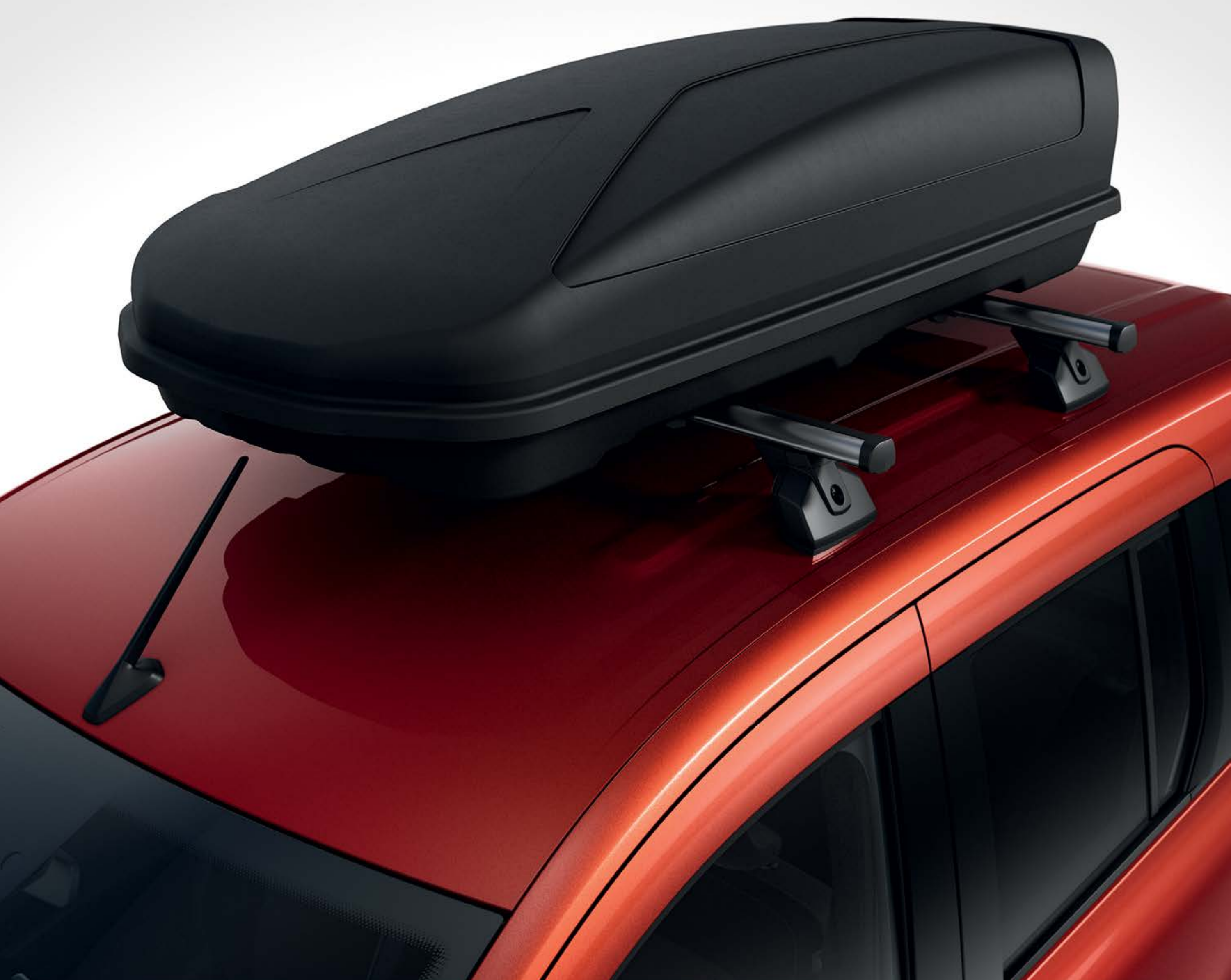
tvrdi krovni kovčezi od 480 litara (77 11 785 586)

Poprečni krovni nosači, krovni kovčezi i fiksne kuke za vuču koje možete skinuti bez alata ispunjavaju vašu želju za bijegom.