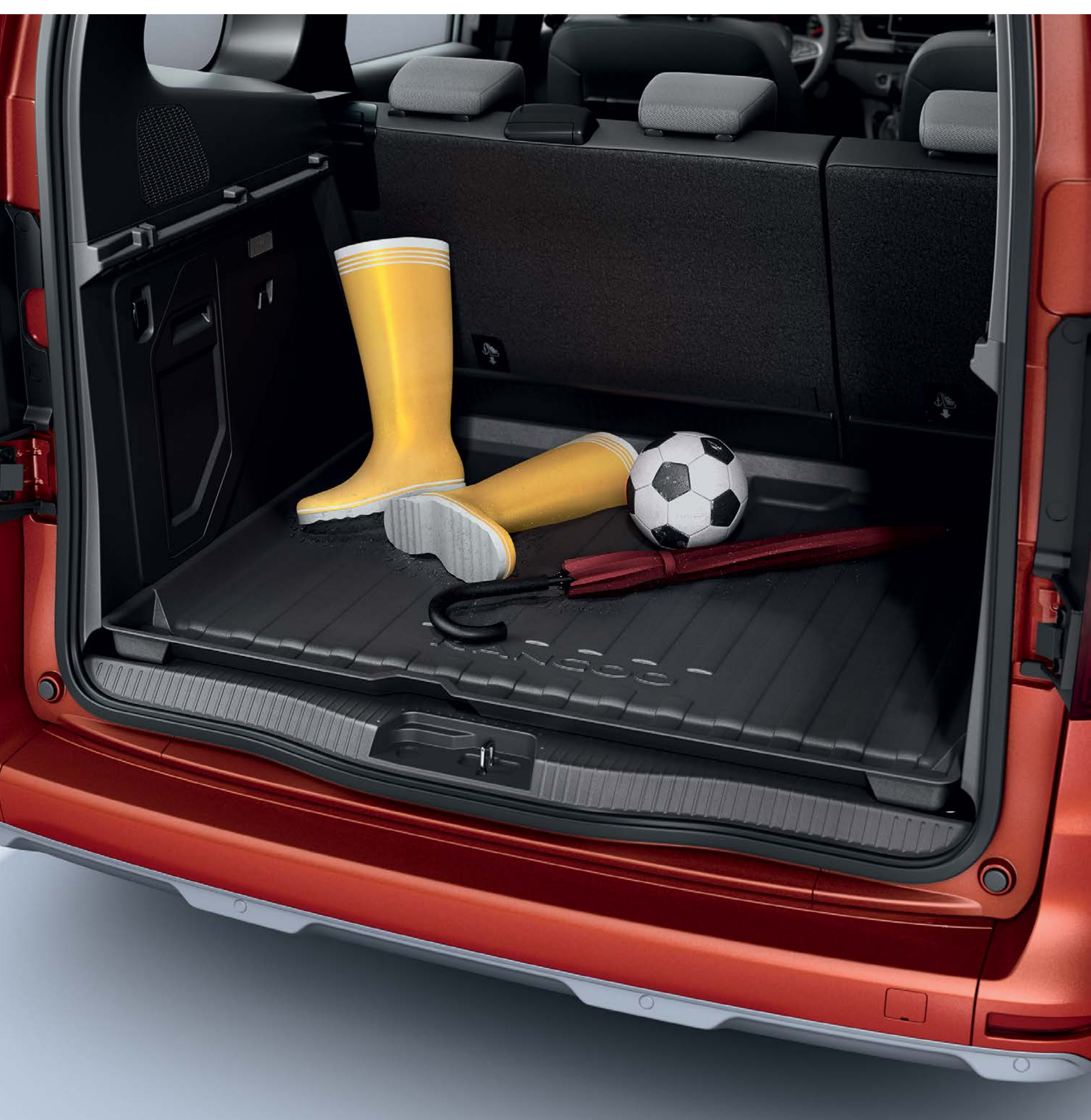
obloga prtljažnika Kangoo (82 01 735 902)

Vodootporna obloga prtljažnika posebno je pogodna za prljave predmete nakon svih vaših aktivnosti na otvorenom.