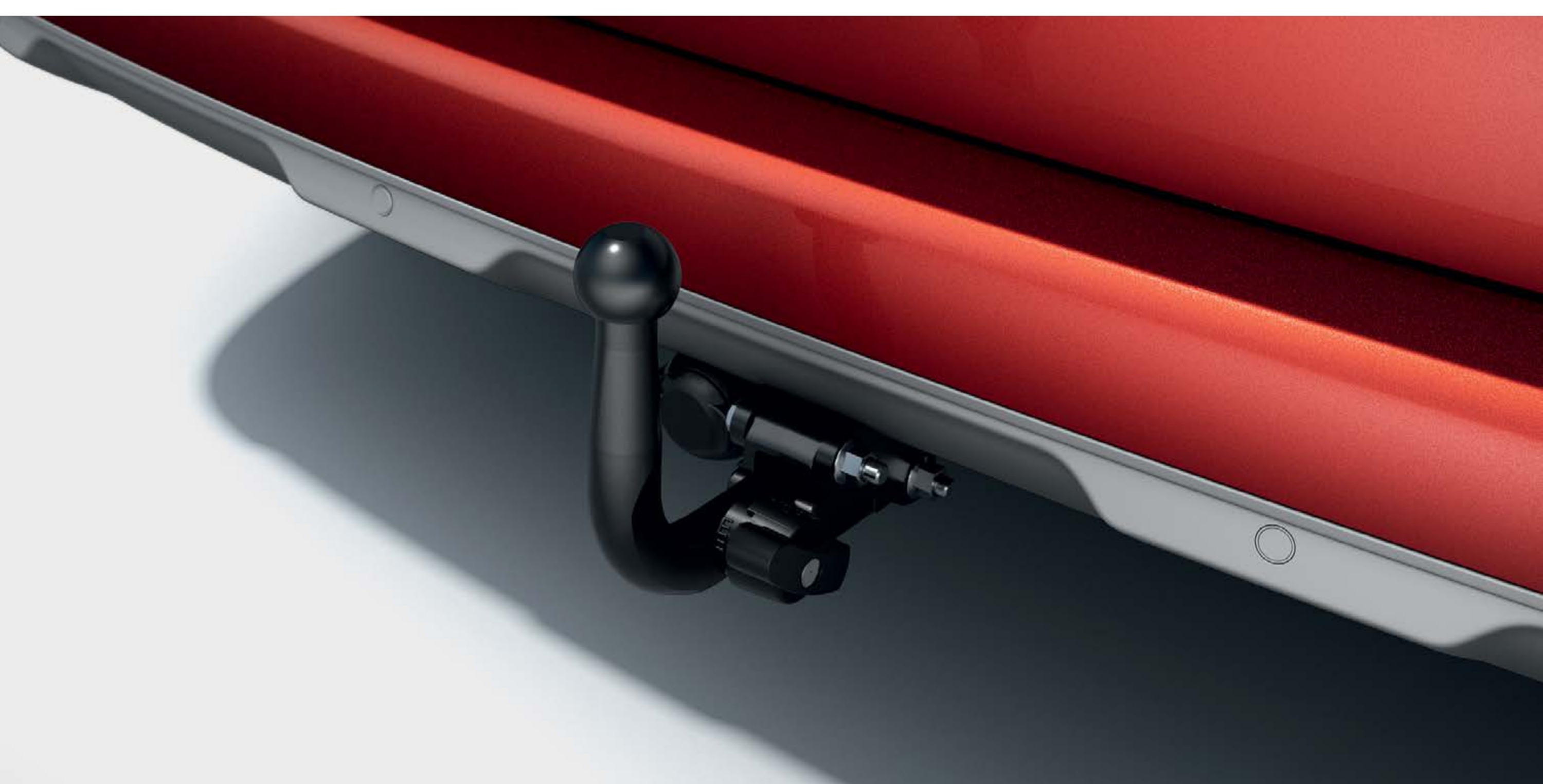
paket s 13-pinskom odvojivom kukom za vuču bez upotrebe ruku (pojediniosti na stranici 10)