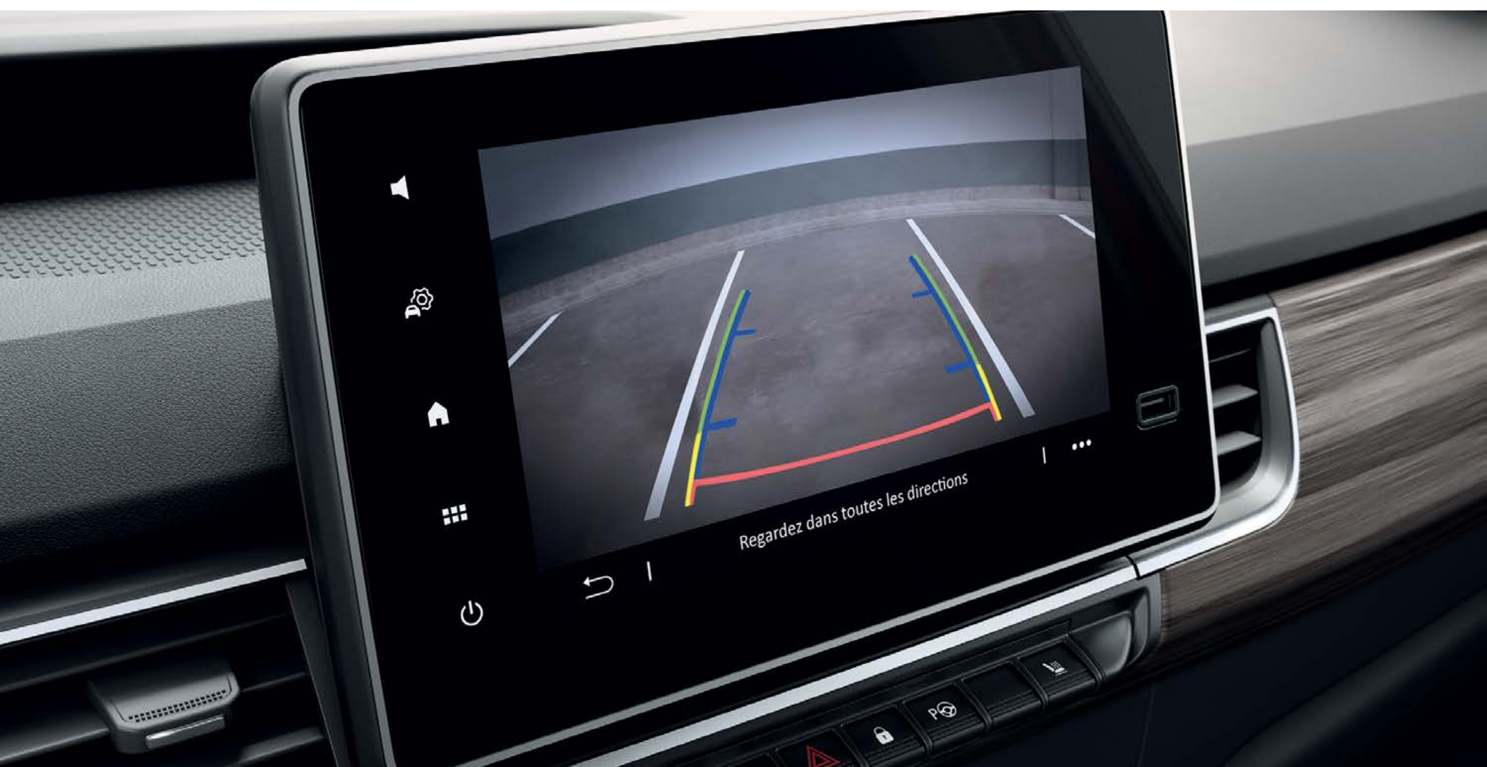
kamera za vožnju unatrag (28 44 274 54R)

S kamerom za vožnju unatrag možete vidjeti moguće prepreke iza vozila i tako ih izbjeći.