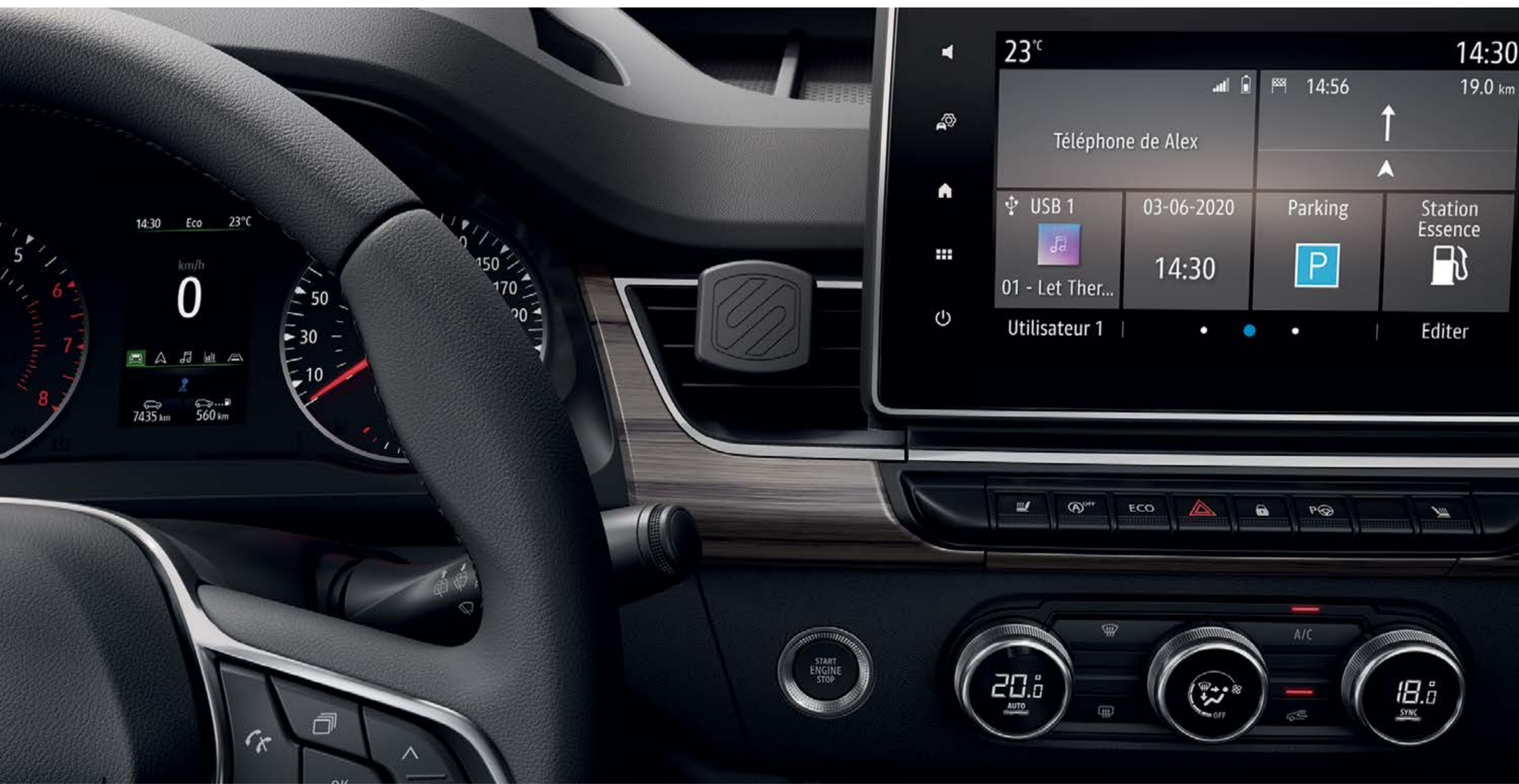
magnetski držač pametnog telefona na ventilacijskom otvoru (77 11 784 774)

Ostanite povezani pomoću magnetskog držača pametnog telefona na ventilacijskom otvoru koji je povezan s instrumentnom pločom.