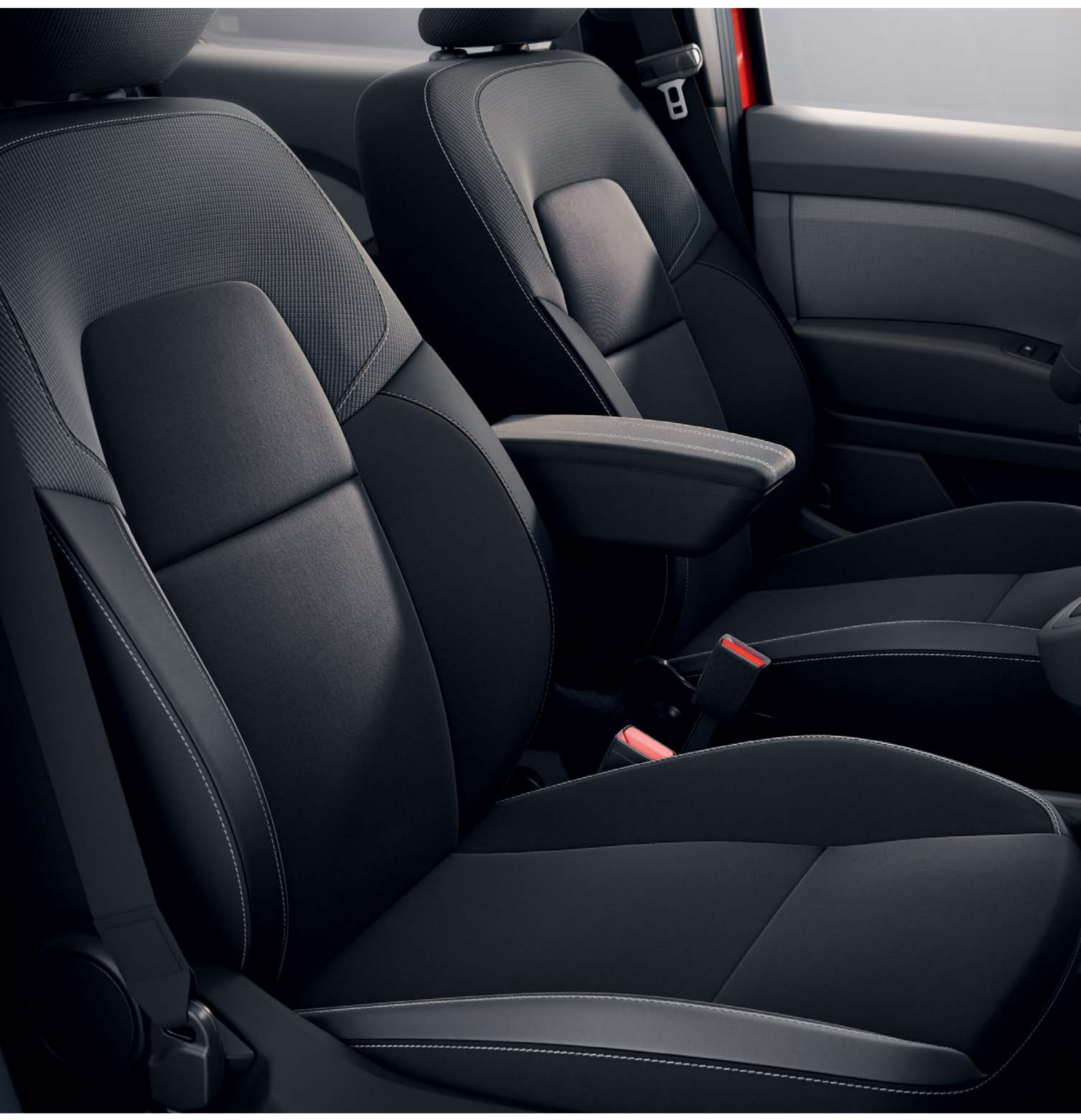
prednji naslon za ruke (87 75 045 04R)

Opremite unutrašnjost vašeg vozila Renault Kangoo dodajući mu prednji naslon za ruke.