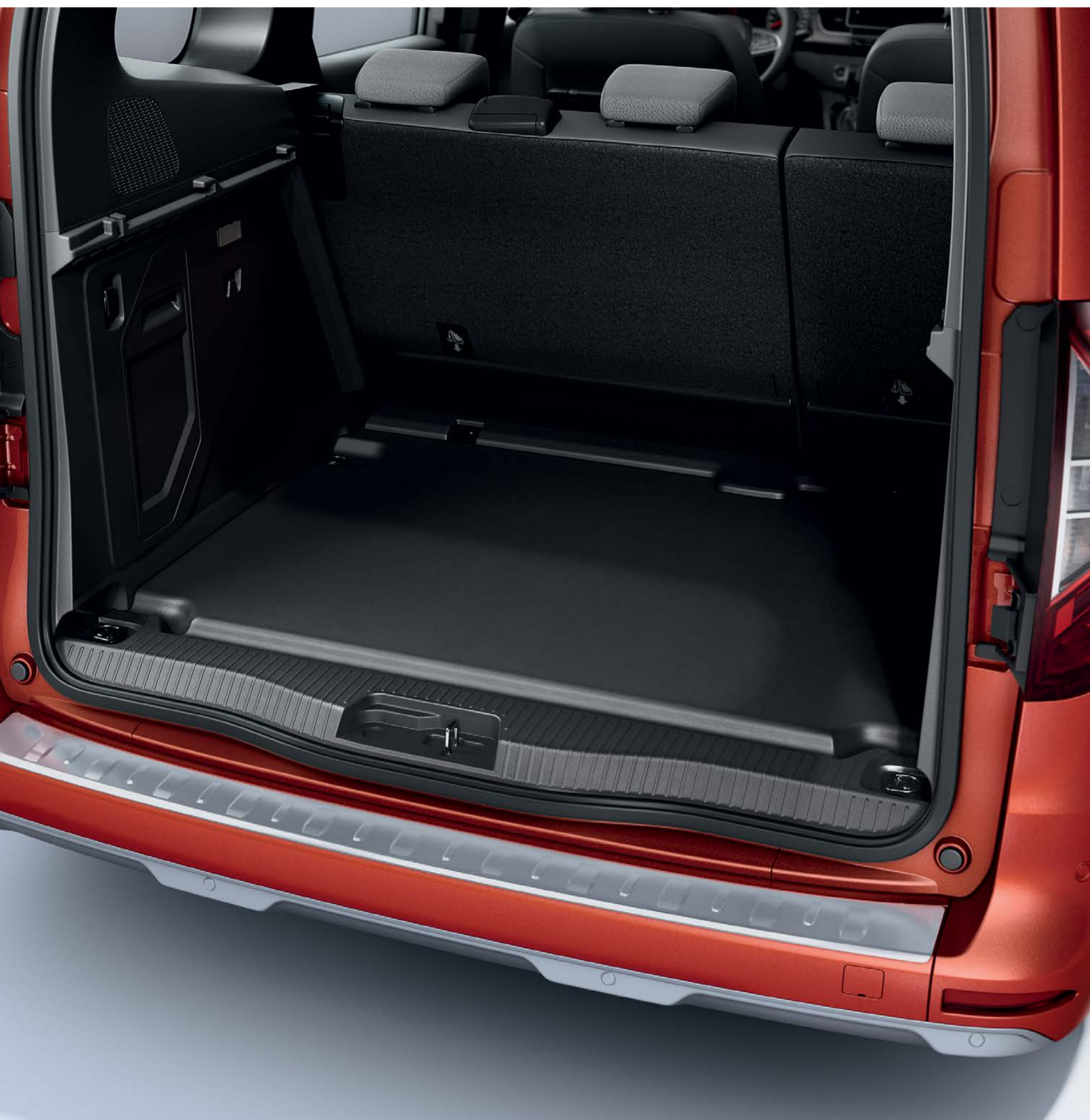
zaštita praga prtljažnika od nehrđajućeg čelika (82 01 726 985)

Otkrijte elegantno rješenje za zaštitu pristupa prtljažniku i odaberite zaštitu praga od nehrđajućeg čelika koja je izrađena po mjeri.