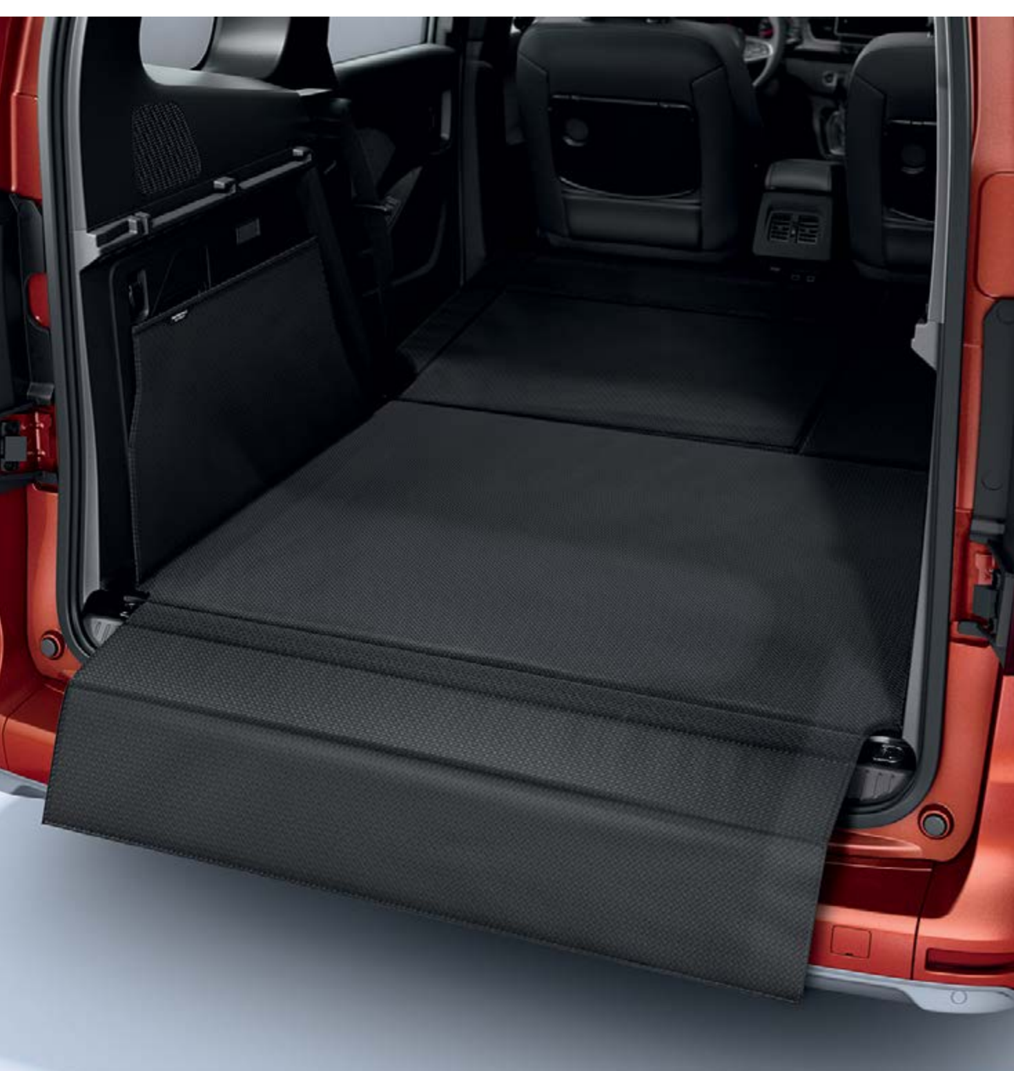
prilagodljiva zaštita prtljažnika Easyflex (82 01 735 903)

Bez obzira na konfiguraciju vozila,, Easyflex zaštita pokriva cijeli prtljažnik i klup: idealno za prijevoz većih predmeta.