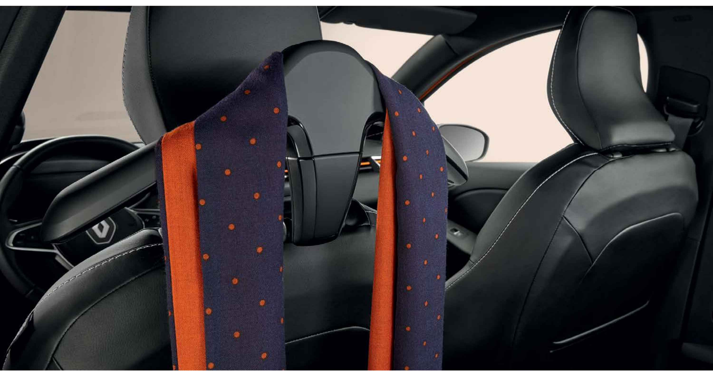
vješalica na višenamjenskom sustavu (77 11 785 946)

S vješalicom koju možete skinuti vaše vozilo je još praktičnije, a na određite stížete s izglačanom odjećom.