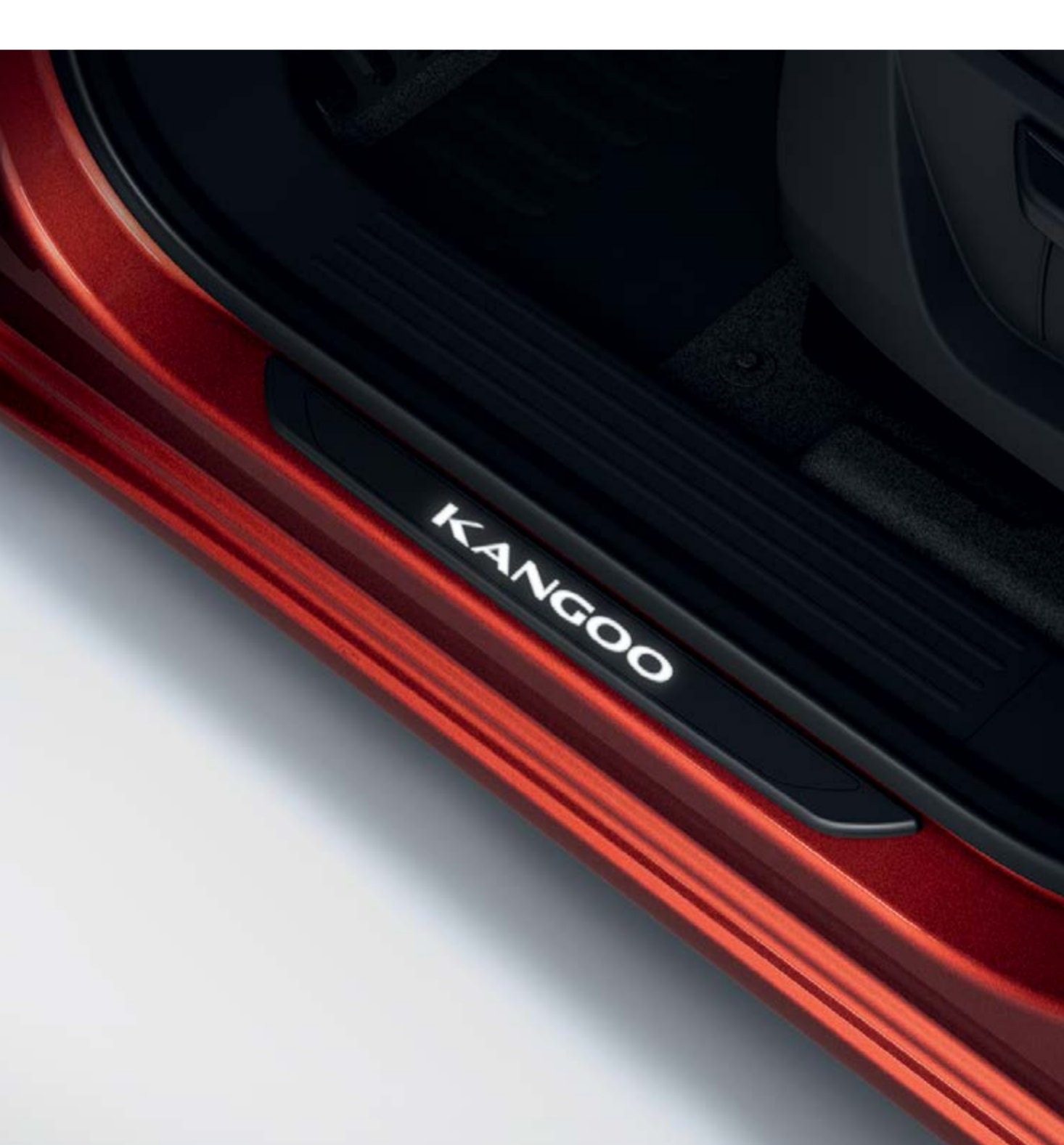
osvijetljene obloge pragova vrata (77 11 945 445)

Osvijetljene obloge pragova vrata ističu originalan izgled vozila i istodobno štite otvore vrata danju i noću.