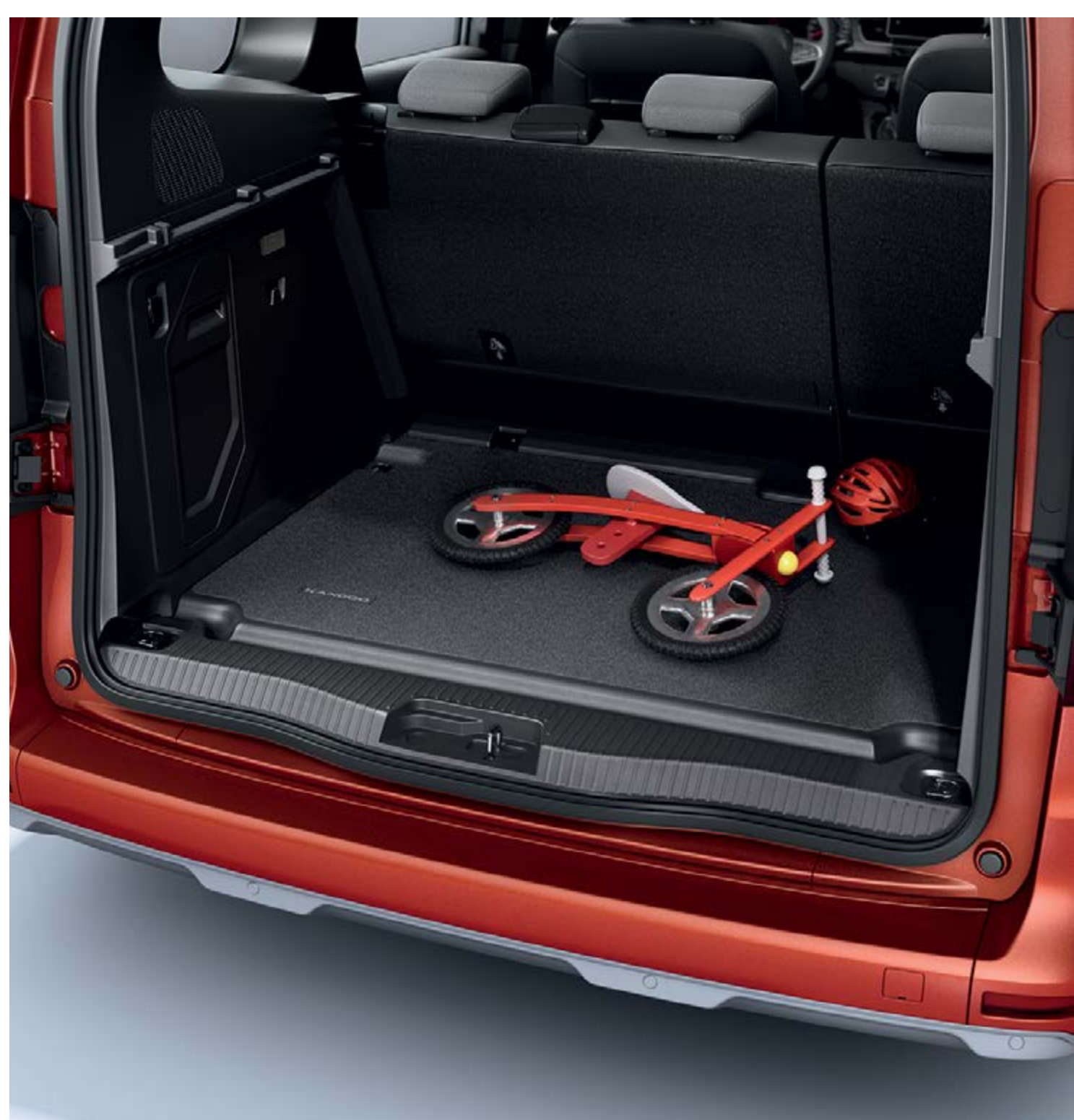
podloga za prtljažnik (82 01 735 435)

Debeli i izdržljivi tepih štiti originalnu oblogu vozila Renault Kangoo.