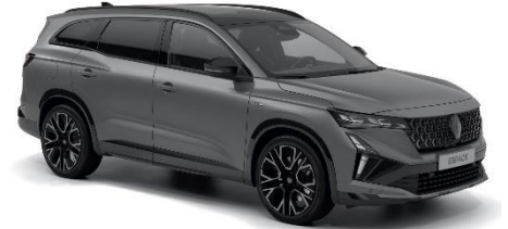
mat siva schiste (3)