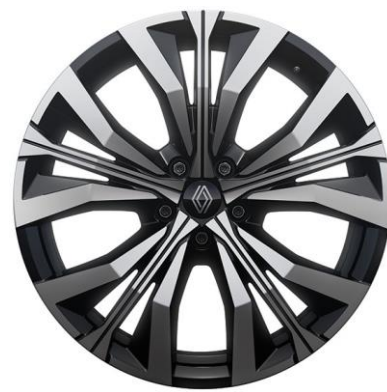
20" alu naplatci Effie