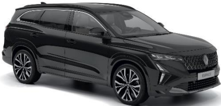
biserno crna (1)