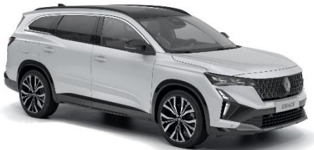
perla bijela (2)