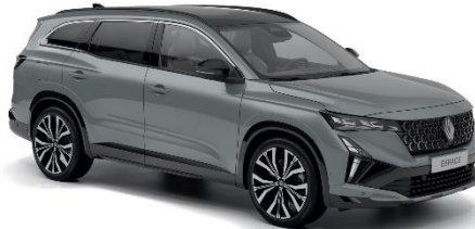
siva baltique (1)