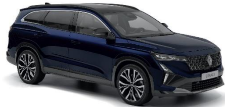
plava nocturne (2)