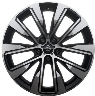
19" alu naplatci Komah