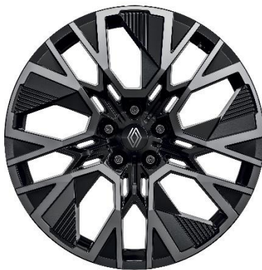
20" alu naplatci Altitude