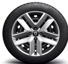
Ukrasni pokrovi kotača 16" Amicitia