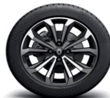
Aluminijski naplatci 16" Boa Vista crne boje