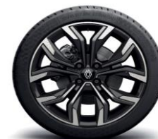
Aluminijski naplatci 17" Monastella