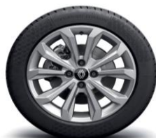
Aluminijski naplatci 16" Boa Vista