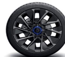
Aluminijski naplatci 17" La Fleche