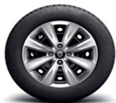
Ukrasni pokrovi kotača 15" Iremia

(1) Obavezno osim pri odabiru boja karoserije TEEQB i TENNP