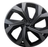
20" alu naplatci Daytona