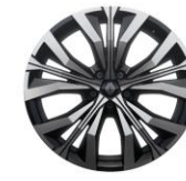
20" alu naplatci Effie