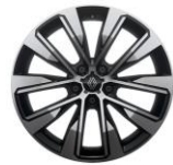
19" alu naplatci Komah

S = Serija O = Opcija P = U paketu - = Nije dostupno