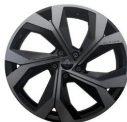
20" alu naplatci Daytona