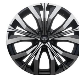
20" alu naplatci Effie