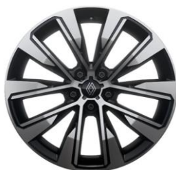
19" alu naplatci Komah

S = Serija O = Opcija P = U paketu - = Nije dostupno