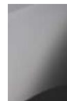
siva schiste mat